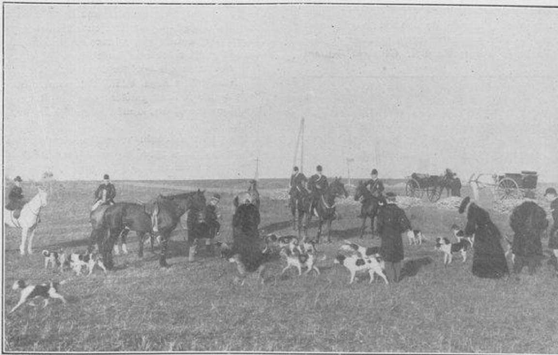
UNE HALTE EN PLAINE

Dans les défaits ou pendant leur quête, tous ces chiens travaillent avec activité, mais dès qu'un camarade a empanné la voie, toute la petite