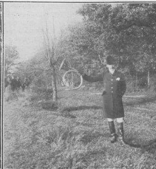
UN HOMME DE L'ÉQUIPAGE