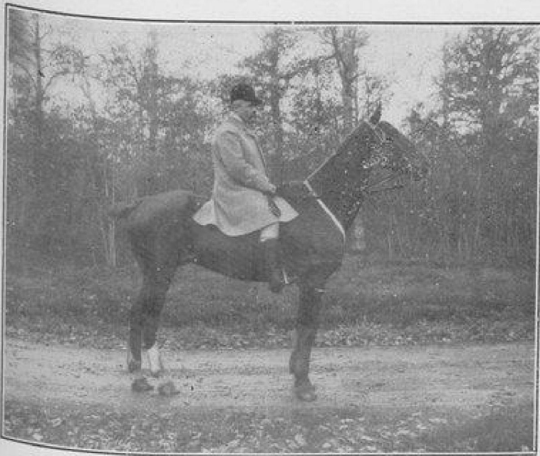
LE MAÎTRE D'ÉQUIPAGE